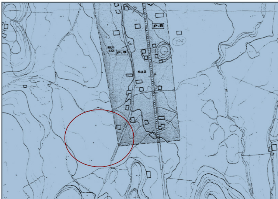
IMAGEN 16: Plano 5.4 de las NN.SS. Zonificación. Clasificación Urbanística del núcleo de Villanueva.

La ubicación de la alternativa seleccionada se muestra en el plano de las NN. SS adjunto.