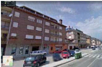
Bloques situados en la margen opuesta al SUNC-4

<MODIFICACIÓN PUNTUAL DEL PGOU DE POTES>