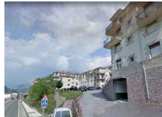
Bloques situados en la misma margen del SUNC-4

Como se puede comprobar, las alturas de los bloques situados junto al SUNC-4 es de baja+III+ bajocubierta, y tipología de manzana o bloque abierto muy definido.